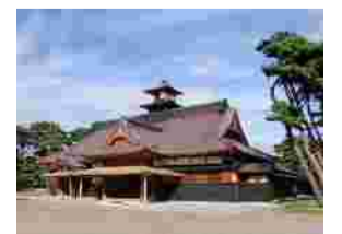
復元された函館奉行所

議題は1.平成22年度活動スケジュールについて、2.2011・TICについて、3.箱館見学会について。特に、TICの講演講師についてと箱館見学会について討議が行われました。