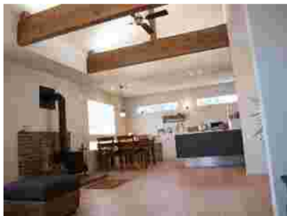
2階リビング 和室 自宅にて

インテリアに関わった仕事をする事は、私の生涯のテーマ。お客様が喜んで下さる仕事ができるときが、鳥肌が立つ程嬉しい!!その感動の為に、知恵を絞ります。とはいえ、まだまだ未熟者だと実感する事も多々あり、日々勉強だとしみじみ感じている今日この頃です。皆様、ご指導の程よろしくお願い致します。