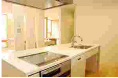
自主製作の独立型アイランドキッチン

弊社の仕事は新築の戸建住宅がメインで、設計だけではなく施工まで通して手がけています。小規模な会社のため、まだまだ新米の私も設計図面を描いたり時には現場へ行って床塗りの手伝いをしたり・・・インテリアコーディネーターの肩書きをはみ出すような幅広い仕事に挑戦する毎日です。私はもともと、まったく違う職業に就いており、働きながらインテリアコーディネーターを目指して勉強していました。社会人4年目の昨年に転職を決意し、インテリアショップでの勤務を経て今に至っています。暮らしの中のデザインに関わる仕事がしたいと思い続け、家というあらゆる面で「大きな」物をお客様に提供する立場に立った今、期待感と同時に大きな責任感を感じています。