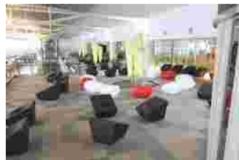
新千歳空港国際線旅客ターミナルビル 札幌市水道局札幌水道記念館 社内風景

私たち、札幌ファニチャーは業務用イス・テーブルの製造・販売、椅子の張替え修理をさせて頂いている会社です。業務内容はイス・テーブルに特化しており、空港等の公共施設・ホテル・レストラン・クリニック等のパブリックスペースに収めさせて頂いております。最近の物件は多種多様で、お客様のご要望を理解し、その空間に合うご提案、プラン等もお手伝いさせて頂いております。また、椅子の張替え需要が近年増えてまいりました。長期間使い続けている椅子やソファー、仕様頻度が高く生地の磨り減り、破けてしまった場合でも張替えることにより、新品同様にまた使い続けることができます。張替えは家具を廃棄する必要がないので環境にも優しいのです。時代とともに椅子も進化し、自社の椅子工房の職人も日々技術の向上に励んで進化しております。