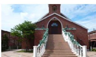
伝統的建造物保存地区にある建物を利用したお店や、赤レンガ倉庫群のあるベイエリア