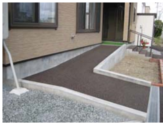
スロープと踏み面 40cm 蹴上げ 10cm の両側手すり階段 ↑ ロードヒーティング、ゴムマット貼

住宅地を歩いてみると、最近ではスロープのある家が結構あります。しかし、屋根なし、ヒーティングなしの急なスロープも見受けられ、冬を思うとゾーっとします。