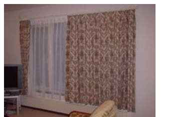
カーテンの納入事例 東リカーテン「プラスポヌール・リヨン織物」より