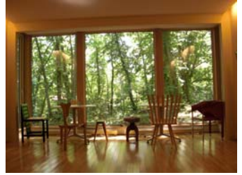
北広島市富ヶ岡 509-22 TEL:011-373-8239