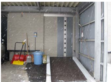
カーポート内 スロープゴムマット貼